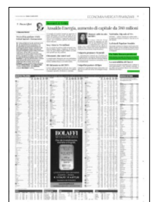
Superficie 1 %

ARTICOLO NON CEDIBILE AD ALTRI AD USO ESCLUSIVO DEL CLIENTE CHE LO RICEVE - L.1878 - T.1619