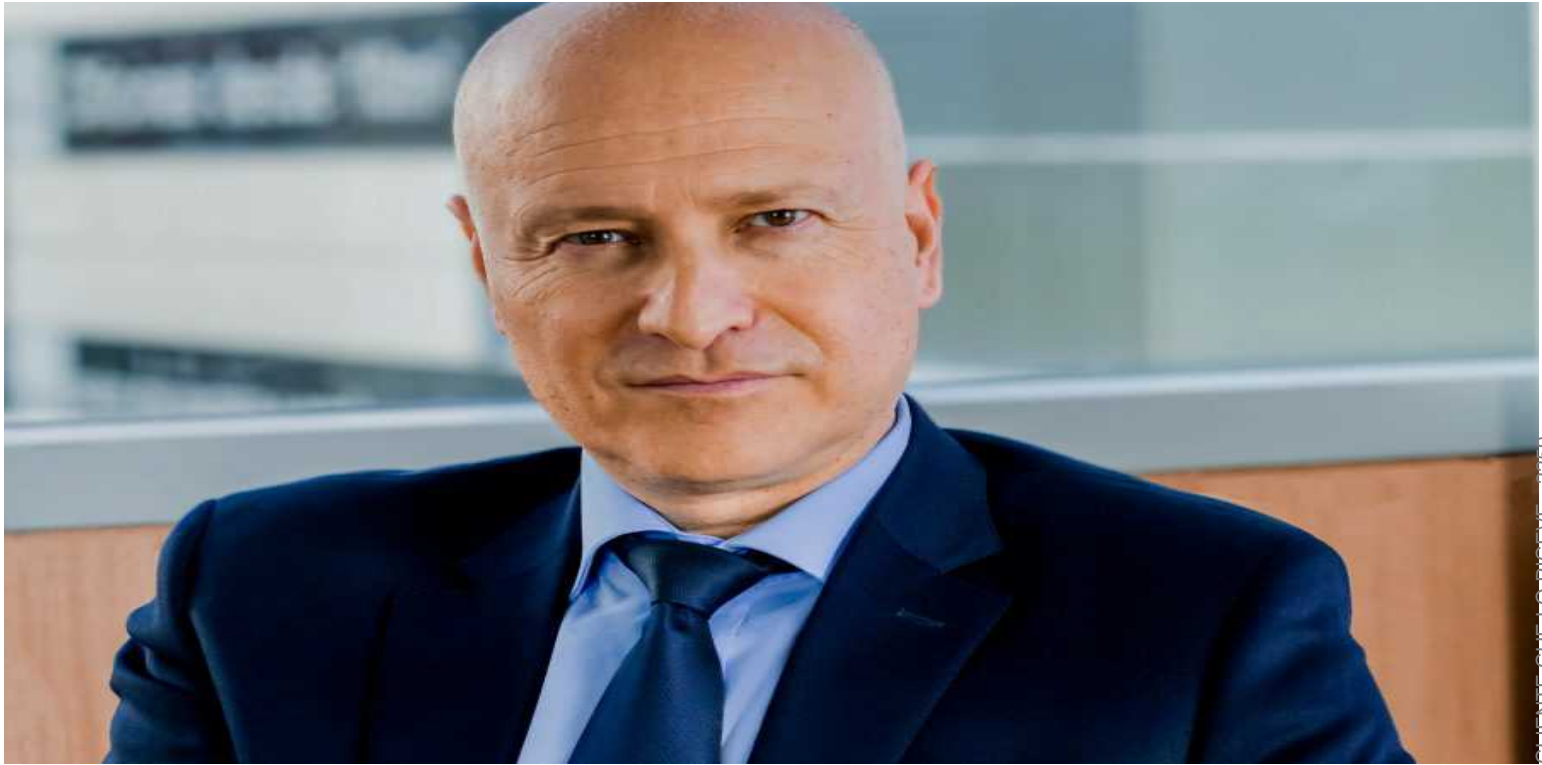
MANAGER di Redazione PrimaOnline