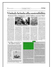
Superficie 4 %

ARTICOLO NON CEDIBILE AD ALTRI AD USO ESCLUSIVO DEL CLIENTE CHE LO RICEVE - L.1721 - T.1721